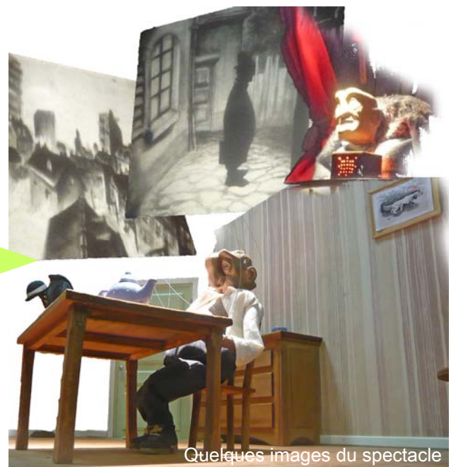
Quelques images du spectacle

gâtés cette année encore par un "déluge" de savoureux gateaux, tous meilleurs les uns que les autres !